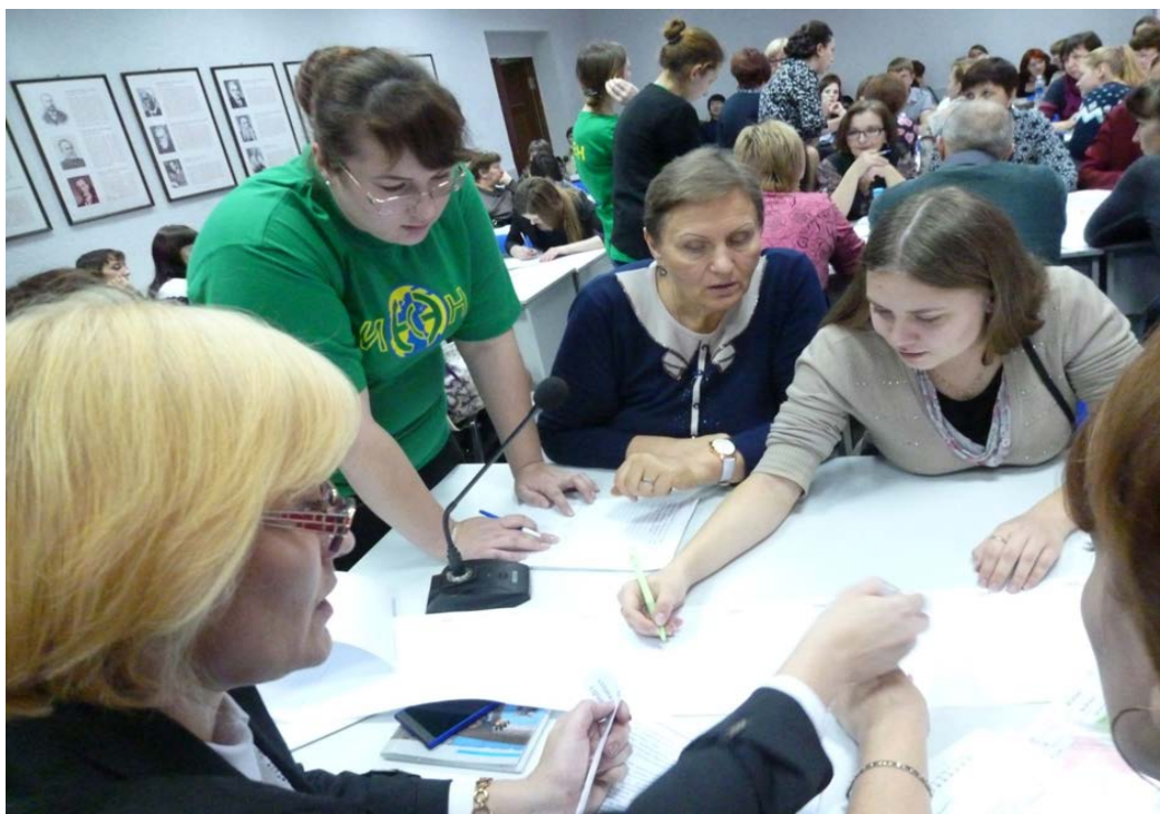
Групповая работа во время кейс-стади