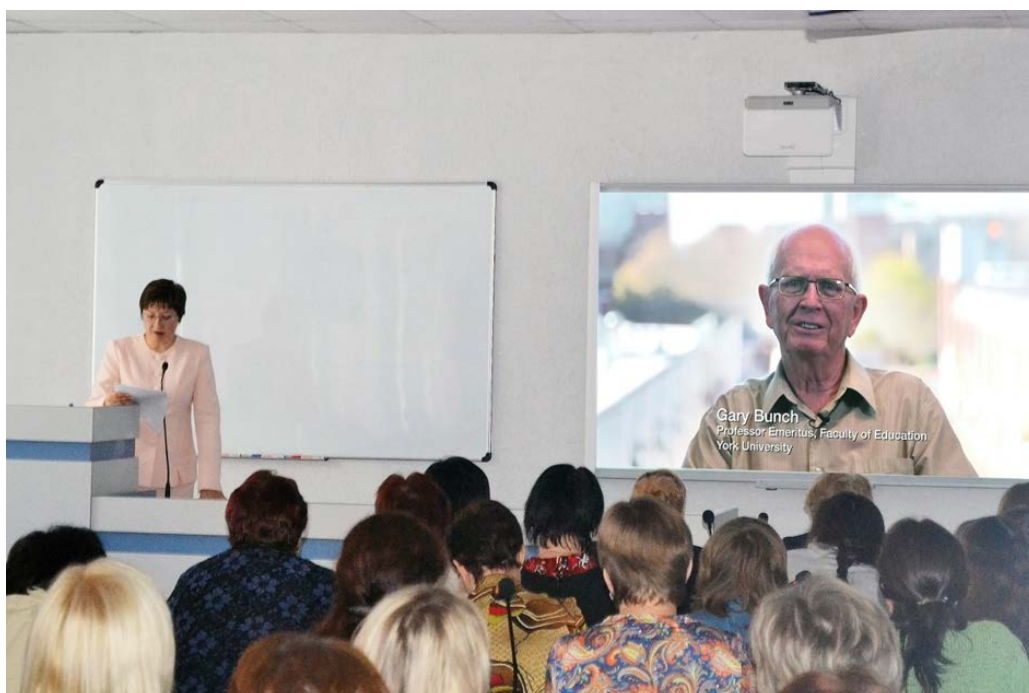
Видео-доклад Г. Банча

тели и учащиеся. Вся информация систематизируется на местном и государственном уровнях. В частности, он отметил, что существенным показателем эффективности инклюзивного образования в школе, колледже и лицее является количество выпускников с ограниченными возможностями здоровья, поступающих в университеты для продолжения образования.