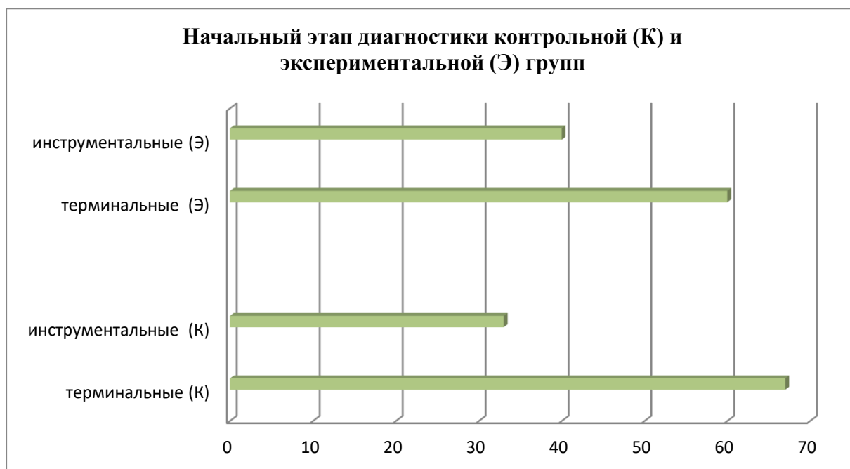
Рис. 2. Определение ценностных ориентаций личности на начальном этапе (%)