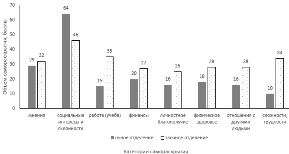
Рис. 1. Объем самораскрытия студентов по категориям самораскрытия Fig. 1. The volume of students' self-disclosure by categories of self-disclosure

и «учебных дел» тех, кто учится с ними в одной группе. Поэтому не испытывают потребности в еще большем самораскрытии по вопросам, связанным с обучением. Анализ объема самораскрытия студентов заочного отделения (см. рис. 1) показал, что респонденты открыто сообщают другим людям информацию о своих социальных интересах и склонностях (46 баллов). На втором месте раскрытие сведений о своей работе (35 баллов) и сложностях, трудностях, неприятностях (34 балла). Почти в такой же степени открыто они высказывают мнения по разным вопросам (32 балла). В меньшей степени студенты заочного отделения оказались склонны раскрывать себя по категориям финансы (27 баллов), личностное благополучие (25 баллов).