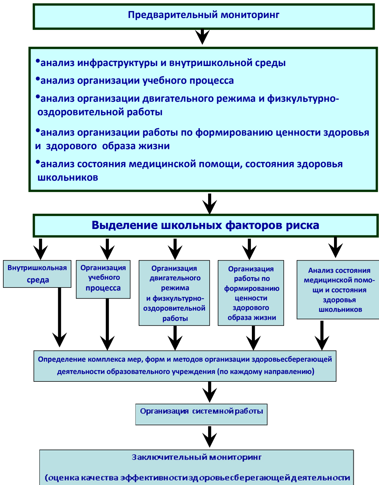
Схема экспертного анализа форм и методов здоровьесберегающей деятельности образовательного учреждения